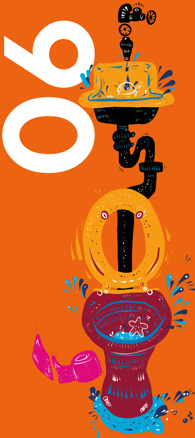
Illustration: Franziska Moltenbrey | Gestaltung: www.das-hinterland.de