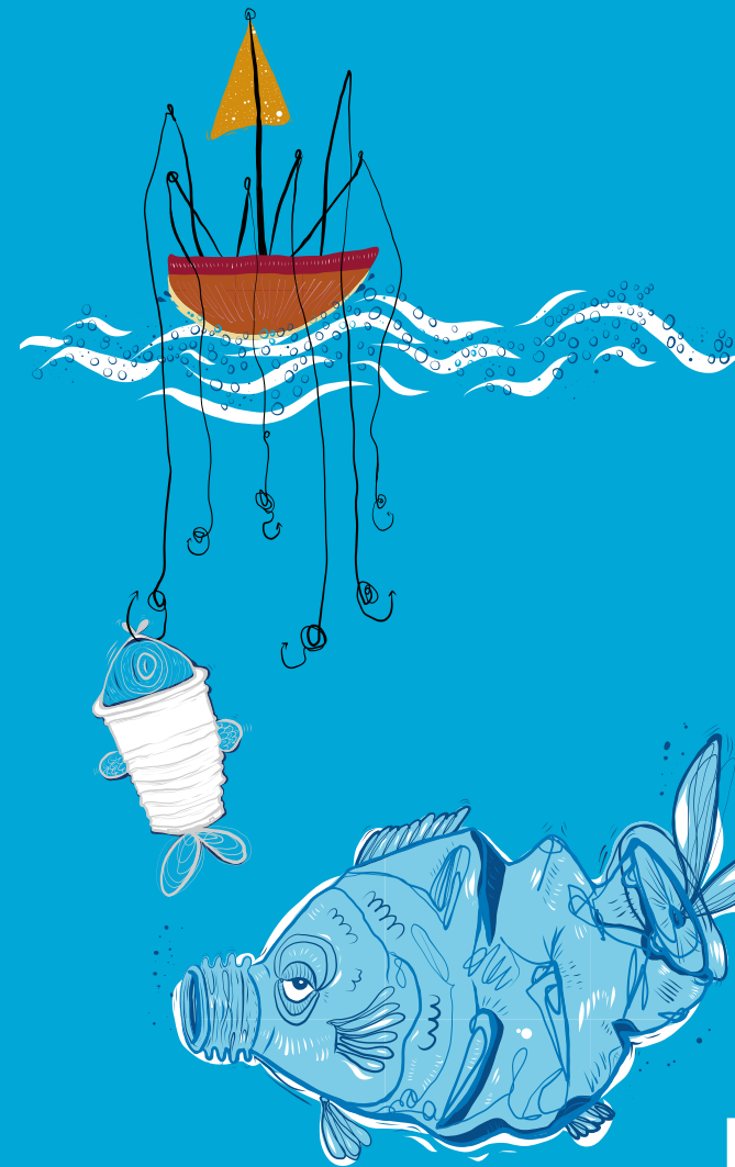
Illustration: Franziska Moltenbrey | Gestaltung: www.das-hinterland.de

„Wir ersticken uns zu Tode mit dem ganzen Plastik, das wir wegwerfen. Es tötet unsere Meere. Wir nehmen es in uns auf, durch den Fisch, den wir essen.“