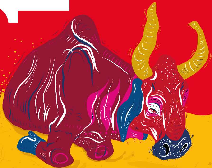
Illustration: Franziska Moltenbrey | Gestaltung: www.das-hinterland.de