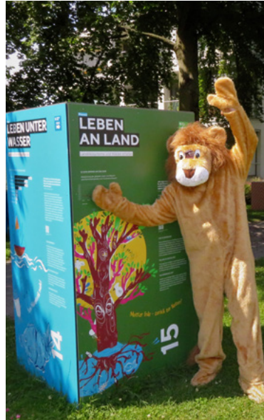
Illustration: Franziska Moltenbrey | Gestaltung: www.das-hinterland.de