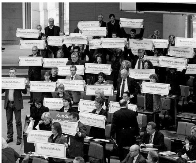
Abgeordnete der LINKEN zeigen im Bundestag Namen der Opfer von Kundus

Durch Politik und Medien werden Terrorismushysterie und Islamophobie geschürt. Damit werden der Abbau demokratischer Grundrechte, Aufrüstung und völkerrechtswidrige Angriffskriege zur Durchsetzung geostrategischer Interessen vorangetrieben. Die wahren Probleme der Menschheit sind jedoch andere: Armut, Hunger und drohende Klimakatastrophe erfordern gemeinsame Anstrengungen der Menschheit. Ohne eine konsequente Friedenspolitik ist keines dieser Problem lösbar.